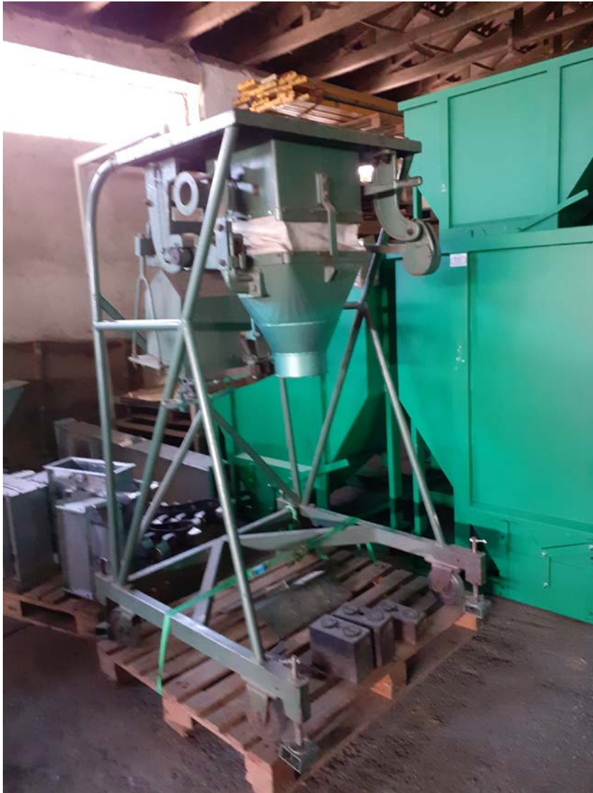
1 Stk. Bruttoabsackwaage für 30 – 50 kg mechanisch Preis auf Anfrage.